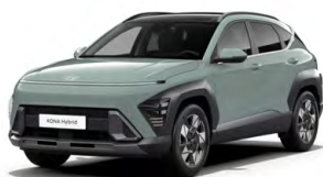
Mirage Green Pastelová Kombinace dostupná také s černým lakováním střechy Cena: 0 Kč