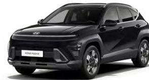
Abyss Black Pearl Perleťová Cena: 17 900 Kč