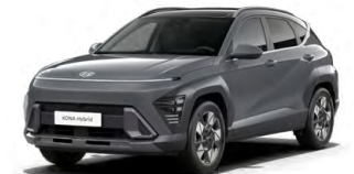
Ecotronic Gray Pearl Perleťová Kombinace dostupná také s černým lakováním střechy Cena: 17 900 Kč