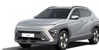
Shimmering Silver Metallic Metalická Kombinace dostupná také s černým lakováním střechy Cena: 17 900 Kč