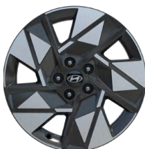
18" kola z lehké slitiny