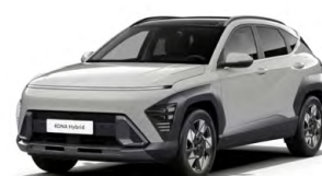
Cyber Gray Metallic Metalická Kombinace dostupná také s černým lakováním střechy Cena: 17 900 Kč