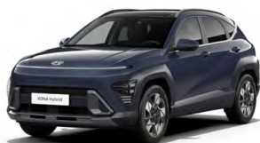
Denim Blue Pearl Perleťová Kombinace dostupná také s černým lakováním střechy Cena: 17 900 Kč