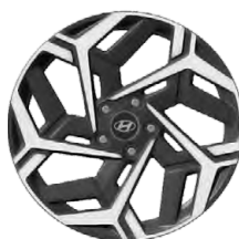
Unikátní N Line 18" kola z lehké slitiny

www.porovnejhyundai.cz (Porovnejte si vozy Hyundai s konkurencí)