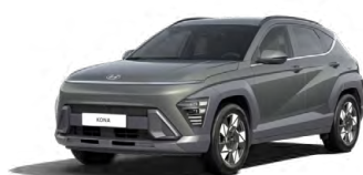
Amazon Gray Metalická Kombinace dostupná také s černým lakováním střechy Cena: 17 900 Kč