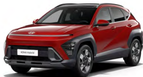
Ultimate Red Metallic Metalická Kombinace dostupná také s černým lakováním střechy Cena: 17 900 Kč