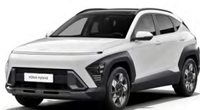
Atlas White Pastelová Kombinace dostupná také s černým lakováním střechy Cena: 9 900 Kč