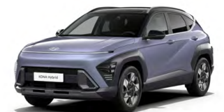
Meta Blue Pearl Perleťová Kombinace dostupná také s černým lakováním střechy Cena: 17 900 Kč