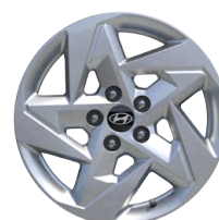
17" kola z lehké slitiny